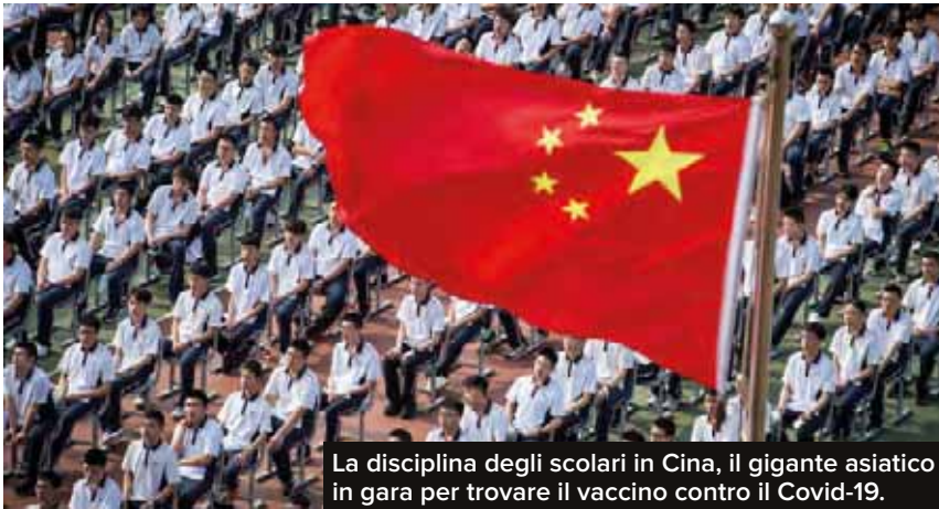
La disciplina degli scolari in Cina, il gigante asiatico in gara per trovare il vaccino contro il Covid-19.