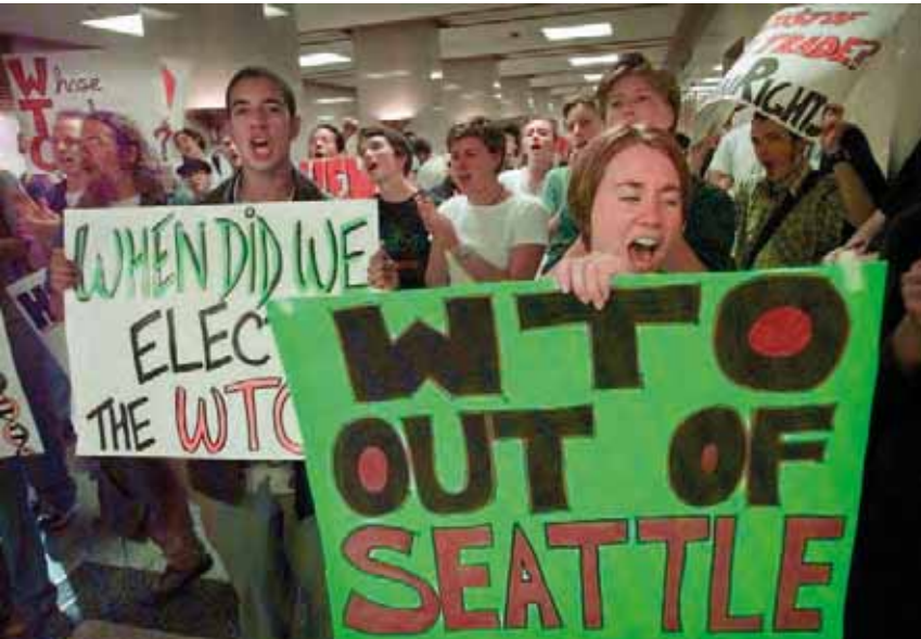
Manifestazioni a Seattle, negli Usa, per ribadire le ragioni del contrasto alle regole della Wto (Organizzazione mondiale del commercio) contrarie ai diritti umani.

Si spera nel vaccino prima del 2021, ma i tempi di verifica ordinari richiedono da 2 a 5 anni. L'Oms comunica lo stato effettivo delle ricerche su www.who.int/teams/blueprint/covid-19 .