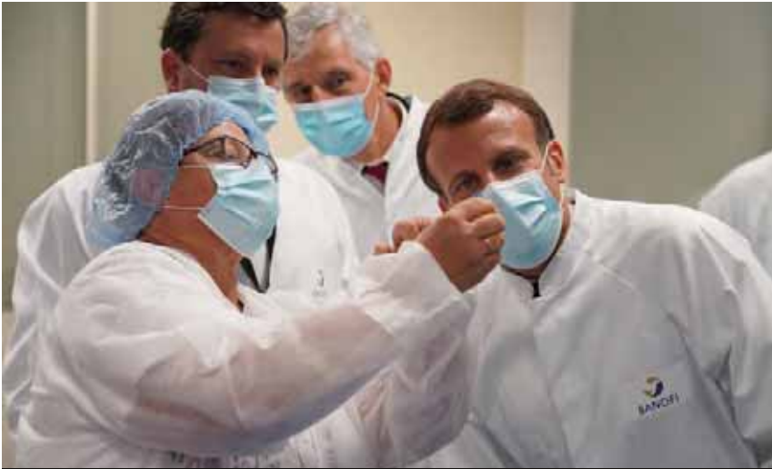
Il presidente francese Macron in visita ai laboratori di ricerca della società Sanofi.

senza l'autorizzazione del detentore del brevetto. Come ci dice Silvia Mancini, di Medici senza frontiere, davanti alla pandemia da coronavirus, non possono valere le regole sulla proprietà intellettuale del vaccino «quando sono in gioco miliardi di vite umane e l'intera popolazione mondiale deve essere immunizzata».