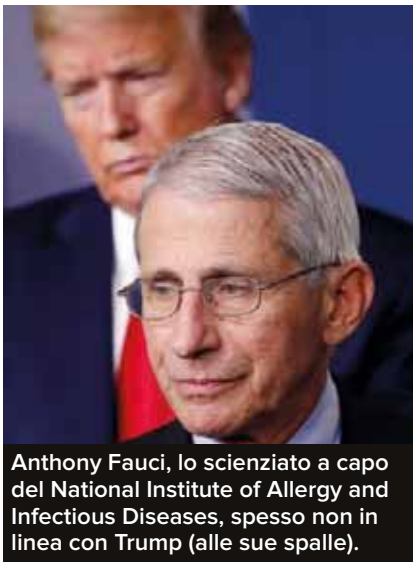
Anthony Fauci, lo scienziato a capo del National Institute of Allergy and Infectious Diseases, spesso non in linea con Trump (alle sue spalle).

maggior parte dei vaccini immessi oggi sul mercato è protetta da brevetti. Ad esempio, il Pcv13, l'attuale vaccino contro vari ceppi di polmonite somministrato ai bambini, costa centinaia di dollari perché è sottoposto al monopolio della casa farmaceutica Pfizer, a cui frutta 5 miliardi di dollari all'anno. E nonostante la Gavi (un'associazione in cui ci sono, tra gli altri, l'Oms, l'Unicef e la fondazione Gates) copra alcuni dei costi del vaccino nei Paesi in via di sviluppo, molte persone non possono permetterselo». D'altra parte, come riporta Marco Valsania su Il Sole 24 ore , esistevano, già nel 2016, progetti