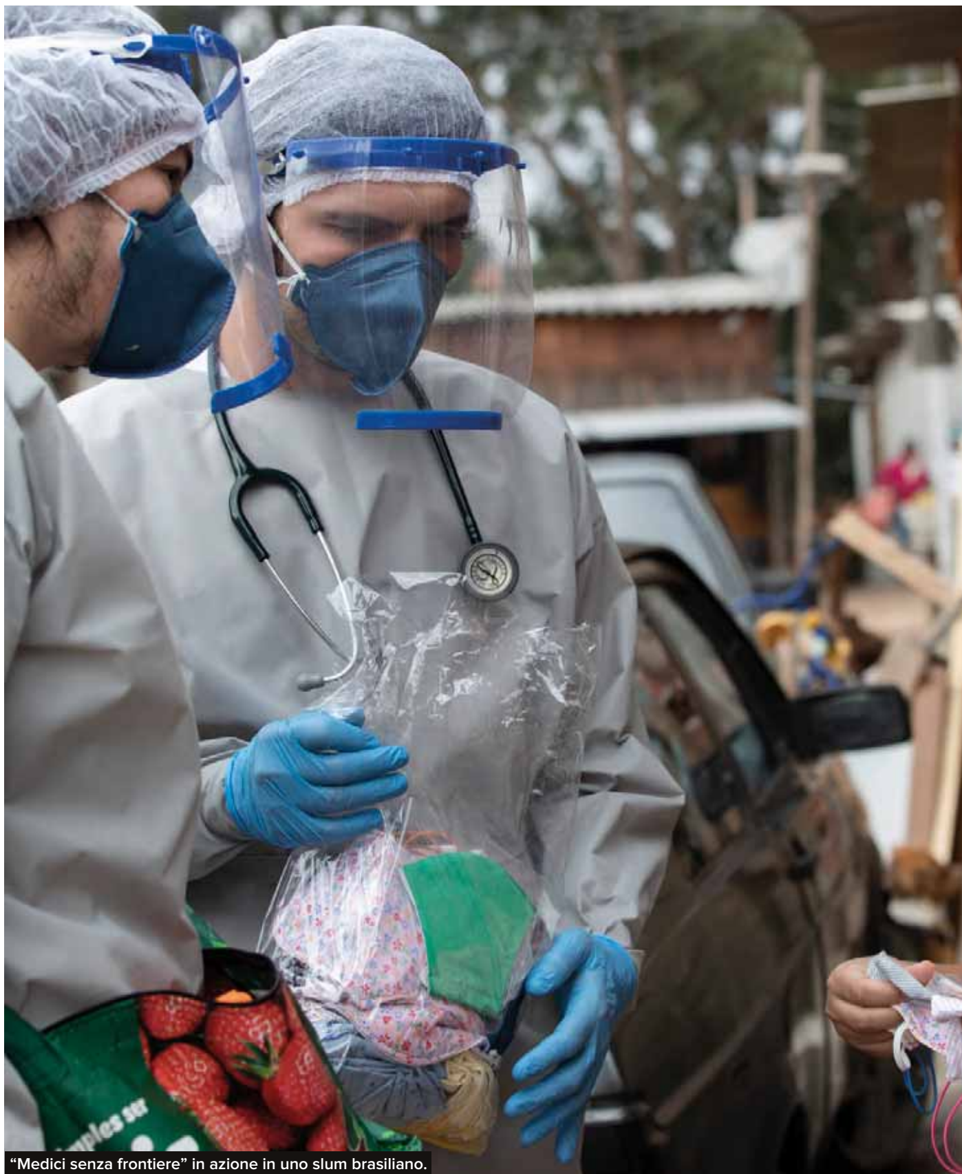
“Medici senza frontiere” in azione in uno slum brasiliano.