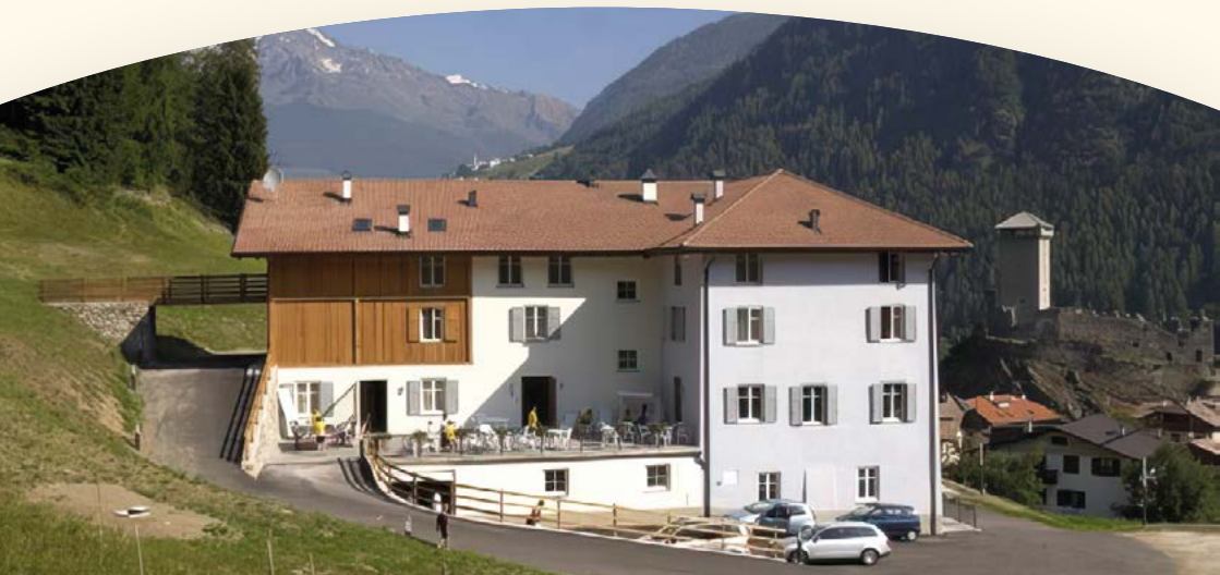
Una delle sedi della Summer School, Fondazione San Vigilio (Ossana, Val di Sole, TN)

Nella consapevolezza delle grandi difficoltà che nell'attuale transizione culturale e antropologica stanno attraversando vaste fasce giovanili, soprattutto quelle più fragili e svantaggiate, e partendo dall'evidente necessità che l'orientamento alle scelte di vita e professionali debba essere gradualmente accompagnato negli anni giovanili per stimolarne forme più mature e responsabili, l'Istituto Universitario Sophia in collaborazione con altri istituti e centri di ricerca, intende offrire un proprio originale contributo formativo alle scelte e agli stili nel campo delle professioni educative .